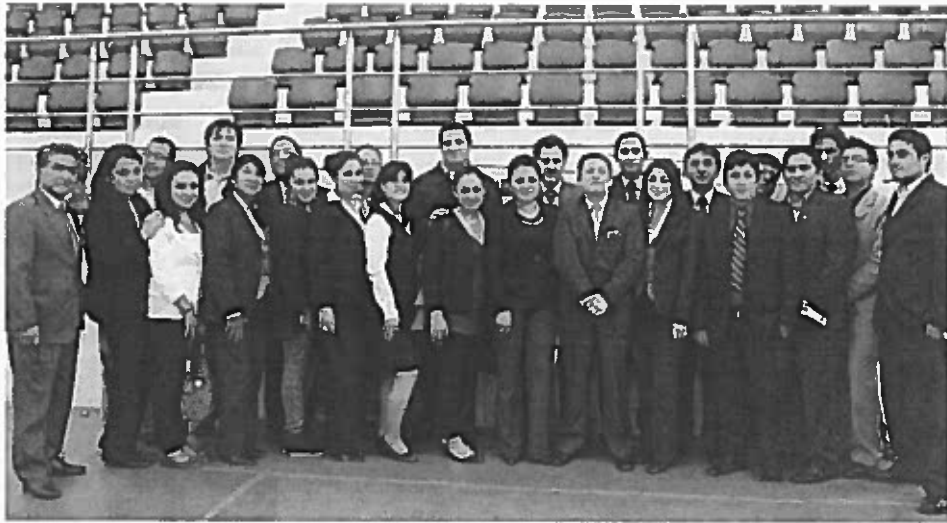
Servidores Públicos de la EP-EMAPA-A