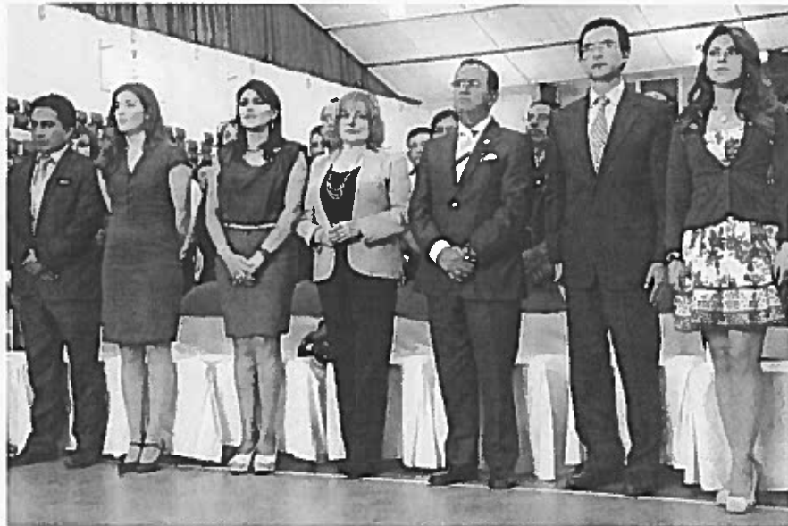
Rendición de Cuentas Año Fiscal 2014 GADMA